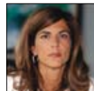
Dott.ssa Emma Marcegaglia Presidente Confindustria