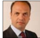
On. Avv. Angelino Alfano Ministro della Giustizia

ore 10.00 “Professioni & Impresa. Riforme, innovazioni e competitività”