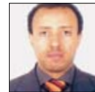
Ato Abebe Kelemu Ministro Consigliere Ambasciata di Etiopia in Roma