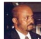
Tadesse Haile Ministro del Commercio e dell'Industria Repubblica Federale di Etiopia