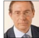
On. Adolfo Urso Vice-Ministro con delega al Commercio Estero

ore 15.00 “Crisi d'Impresa. Internazionalizzazione & Professioni”