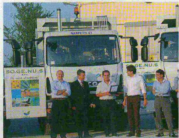
Nella foto la cerimonia di consegna con il management di SOGE

stezza e confort di guida completano le caratteristiche di successo, scelto dalle maggiori aziende locali che internazionali. A queste qualità Naspetti V.I. associa la garanzia di un'assistenza grazie ad una struttura che, oltre alla sede di Falconara Marittima, è presente con le proprie officine a Civitanova Marche e Colonnella (TE) e con un totale di ben 25 officine autorizzate.