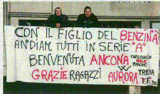
Anche a Treia c'è simpatia per la squadra dorica seconda in classifica

biamo curato particolarmente la parte tattica". Un punto raccolto negli ultimi 180' non è certo il ritmo di inizio stagione, ma Zavagno vuole fugare subito ogni preoccupazione. "Ricordiamoci