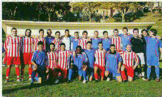
L'Ancona e l'Aurora Treia posano insieme