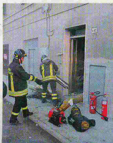
IN AZIONE I vigili del fuoco

Chi ha ricevuto meno danni a causa del fumo ha potuto fare rientro negli alloggi, per altri è stata necessaria una notte fuori di casa da parenti o amici in attesa di risistemare le utenze e ripulire le rispettive abitazioni. Il rogo si è scatenato nel tardo pomeriggio di mercoledì, paura per una donna incinta soccorsa da vigili del fuoco e 118 prima che fosse troppo tardi. La donna sta bene. Spettacolari le manovre di evacuazione del palazzo, molti condomini dei piani alti sono stati tirati fuori grazie all'autoscala dei pompieri.